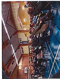
Voeux du Maire 27 Janvier 2025