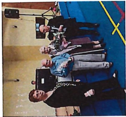
Concours de Dictée organisé par Bethisy Festif 20 Février 2025