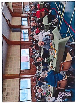
Repas des anciens le 19 Janvier 2025