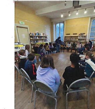
Festival Paroles octobre - novembre Bibliothèque