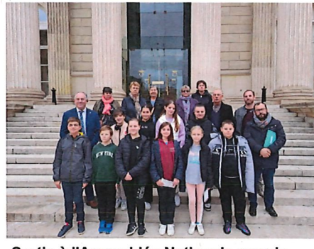
Sortie à l'Assemblée Nationale avec le Conseil des Jeunes