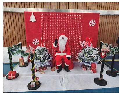
Marché de Noël 03/12 Salle Dransart