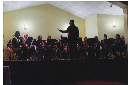
Concert de la Sainte Cécile 18/11 Salle Dransart