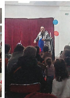
Spectacle de Magie 10/12 Salle des fêtes