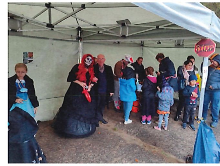
Animation Halloween par les Marmots du Val d'Au - 28/10