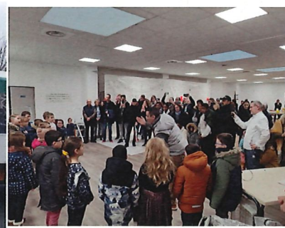
Téléthon 09/12 Salle des fêtes