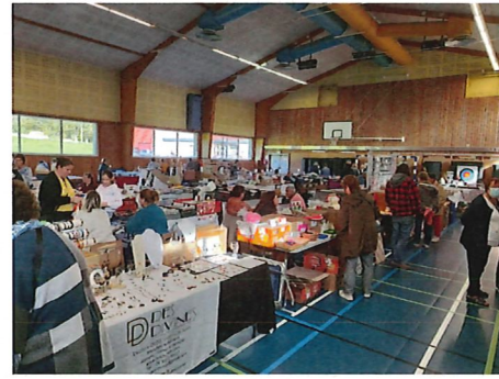
Puces des Couturières