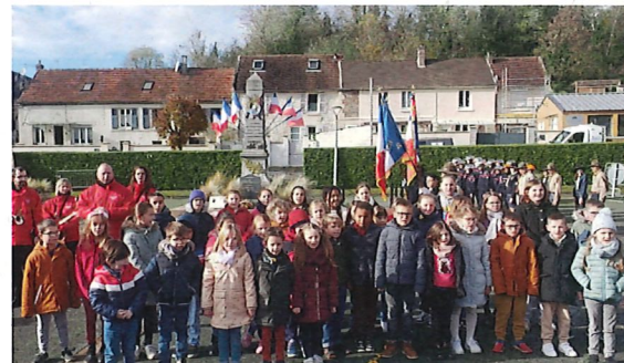
Commémoration du 11 novembre avec chant des enfants des deux écoles primaires