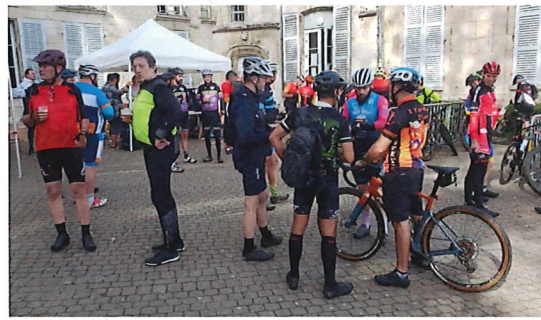
Randonnée du Souvenir