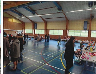
Bourses aux jouets - 26/11 Salle Dransart